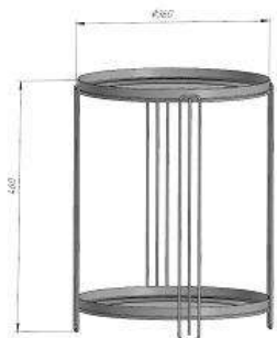
Общий вид изделия