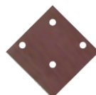
4. Крепёжный эл-т 4 шт.