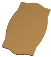
1. Столешница - 1 шт. (Берже 2 - квадрат)